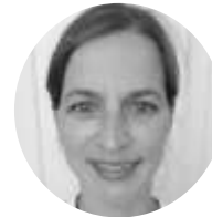
Mme KUNTE FR, DE, EN