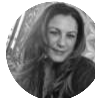
Mme UYKIZ FR, DE, EN, Turc