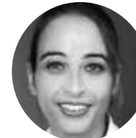
Mme NASFI FR, EN, DE