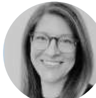
Mme WADDELL FR, EN