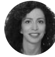
Mme TYAN-GROß FR, DE, EN, Arabe