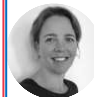
Mme BOONSTRA EN, DE